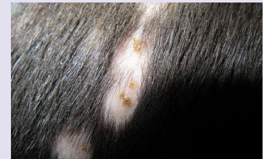
Figuur 4 Detailopname waarop de beten en de kale plekken als gevolg van het wegschuren van de haren goed te zien zijn.