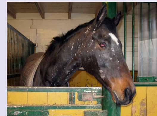
Figuur 3 Een paard met de typische laesies ten gevolge van Dermanyssus ; in deze stal werd ook de eigenaresse door de mijten 'overlopen' als zij 's avonds kwam voeren.

Het belangrijkste klinische symptoom van een infestatie met Dermanyssus is de vaak heftige jeuk. Die jeuk kan, als de kippen doorgaans boven het paard zitten, vooral aan de bovenzijde van het paard zijn en als de kippen door het stro lopen vooral aan het hoofd (de snoet) en de benen voorkomen (figuur 3 en 4). In principe hebben de mijten voorkeur voor de plaatsen waar de huid dunner is, zoals snuit, uier en lies, maar ook elders kunnen bijtplekken en dus jeuk voorkomen. In principe kunnen ook Ornithonyssus spp., mijtensorten die normaal op vogels of op ratten en muizen leven, problemen bij het paard veroorzaken. Sommige Ornithonyssus soorten leven ook overdag op de gastheer, maar zijn voor zover bekend in Nederland nog niet op paarden gevonden.