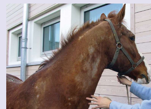
Figuur 6a en b Het min of meer atypische beeld van schuurlaesies ten gevolge van vogelmijt.