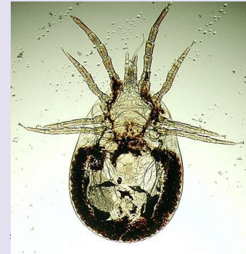
Figuur 1 Dermanyssus gallinae is duidelijk veel groter ( \pm 1 mm) dan de bij paarden veel vaker voorkomende Chorioptes equi ( \pm 0,3 mm).

voorste lichaamshelft, een opvallend kenmerk dat handig is bij een voorlopige determinatie. Dermanyssus gallinae zit overdag verstopt in kieren en spleten van de vogelverblijven of de stallen en valt 's nachts aan om na de bloedsmaaltijd weer te vertrekken. Dit houdt in dat het bij een lichte infestatie vaak moeilijk is overdag de mijt te vinden op de gastheer of dat nu een kip of een paard is.