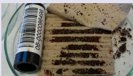
Figuur 5a, b en c Mijtenvallen (Avivet®) zoals die beschikbaar worden gesteld in het project 'Nationale Vogelmit Monitor' (5a en b) en een geopende goedgevulde val uit een kippenstal (5c).